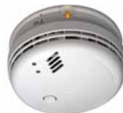
melder + RF sokkel

Ook bij de 9V batterijgevoede melders is draadloos koppelen mogelijk. Bij deze melders wordt het RF signaal verzonden door de ingebouwde RF-module (bij de Ei 405 serie) of door een insteekbare RF-module (Ei 603/605 serie), zie pagina 28.