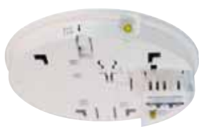
Ei 168RC RF sokkel

Bij de 230Vac Easi-fit® melders vindt de communicatie (zenden en ontvangen) plaats door middel van de RF sokkel type Ei 168RC (deze sokkel wordt in plaats van de standaard Easi-fit® sokkel gemonteerd).